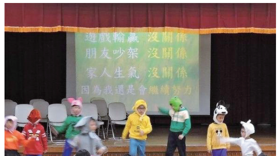
戲劇課程主題曲結合開場舞